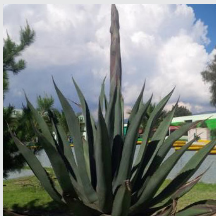
Imagen 1. Maguey pulquero de la especie Agave americana .

La presencia del maguey en México, se remonta a hace 10 mil años, tiempo en el que no ha recibido protección a pesar que ha dado alimento, bebida, techo, vestido, medicina y muchos otros beneficios de suma importancia, al mismo tiempo que ha sido testigo de nuestra historia y ocupa un lugar importante en las manifestaciones culturales de los mexicanos. El maguey “árbol de las maravillas” así lo escribió el jesuita José Acosta en 1590 en su Historia Natural y Moral de las Indias [6], por su aprovechamiento desde sus raíces hasta la punta de sus espinas, fue atacado durante la época colonial y actualmente es menospreciado y marginado. Sin embargo, países como Australia, han aprovechado la oportunidad que ofrecen estas especies y desde 2004 se encuentran importando varios tipos de Agave desde México [7].